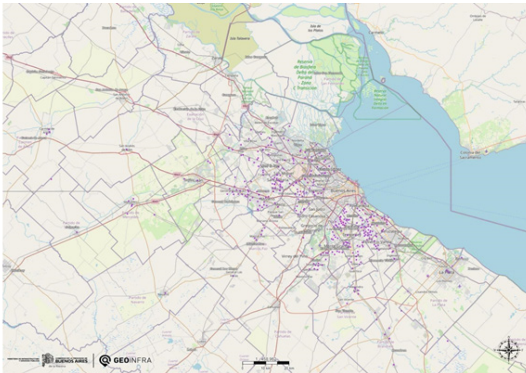
Mapa AMBA de obras de infraestructura del cuidado MINISTERIO DE INFRAESTRUCTURA Y SERVICIOS PÚBLICOS